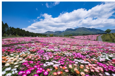
リビングストンデージー